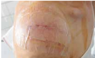
Vroege signalering van infectie