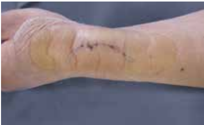
Duidelijke zichtbaarheid van de wond

*Leukomed Control kan tot 7 dagen blijven zitten!