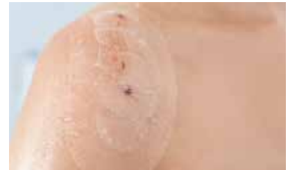
Bescherming tegen bacteriën